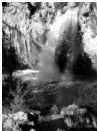
Cascada de La Fuentona en invierno lluvioso.