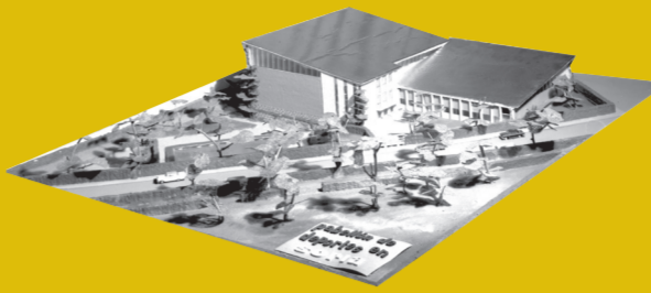
Maqueta del antiguo pabellón.

En los últimos años de los 60 , Soria era un clamor a favor de unas instalaciones deportivas dignas. Hasta entonces todo el deporte soriano se practicaba al aire libre, y el campo del San Andrés no permitía el funcionamiento normal de los equipos deportivos al encontrarse notablemente deteriorado. En aquella época la organización del deporte soriano estaba en manos de unas cuantas sociedades deportivas federadas, pero especialmente, de las Delegaciones del Movimiento, Juventudes y Sección Femenina, la Obra Sindical Educación y Descanso, la Organización Juvenil Española y la Junta Provincial de Educación Física y Deportes. La llegada de la democracia y el inicio de las Autonomías favorecieron el desarrollo de la organización deportiva en federaciones y delegaciones territoriales, y por lo tanto, de los clubes y de un sistema de competiciones profesionalizado. Pero es indudable que contar con unas instalaciones como las del Polideportivo de la Juventud fue importante y el inicio de muchos equipos en distintas disciplinas. En cierta forma, el deporte soriano se amoldó a las características de la Juventud, lo mismo que el pabellón se fue transformando a la medida de los deportes que comenzaron a practicarse gracias al empuje y empeño personal de un puñado de hombres y mujeres sin los que hoy la historia del deporte soriano no sería, o sería muy distinta.