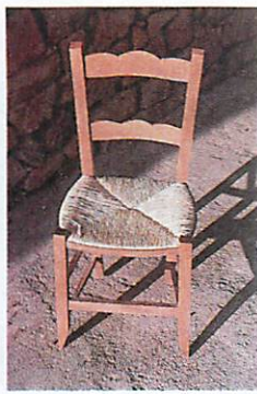
Silla con asiento de enea.

Desde el punto de vista medicinal, la espadaña no tiene desperdicio. Hay datos sobre su uti-