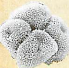
Polen en tétrades de Typha latifolia