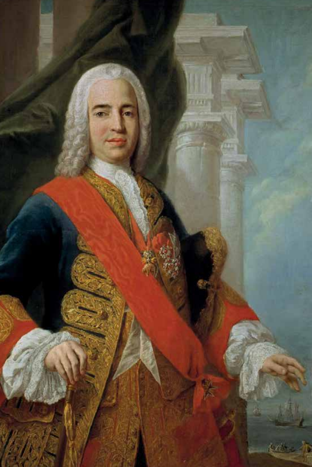
Jacopo Amigoni. Retrato del marqués de la Ensenada (detalle), hacia 1750. Óleo sobre lienzo, 124 x 104 cm. Madrid, Museo del Prado, Planta 1, Sala 022, n.º de cat. P002939