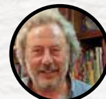
JULIO LLAMAZARES La duda en Machado