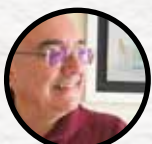
RICARDO DE LA FUENTE BALLESTEROS Alrededor de Antonio Machado: Impresionismo y haiku