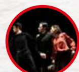
ESTOS DÍAS AZULES Espectáculo por CocinandoDanza